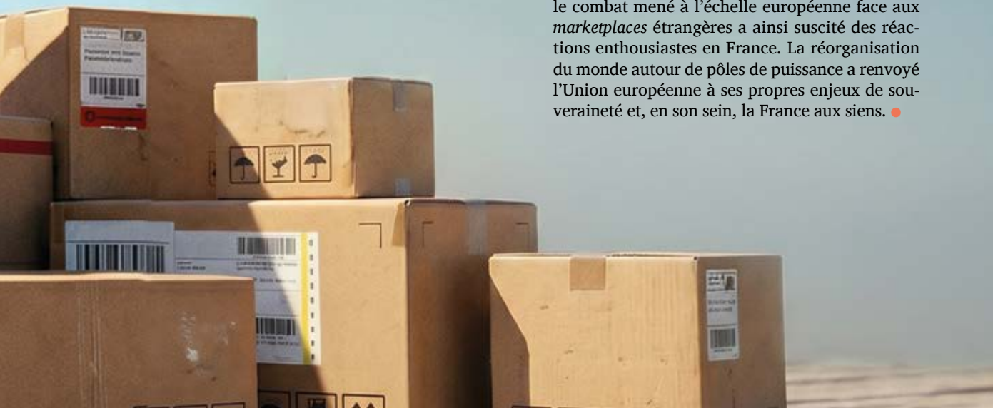
DR/Image générée par IA

Mais de quoi la souveraineté est-elle le nom ? Longtemps cantonnée, dans l'ombre du souverainisme, au rejet du fédéralisme européen par les tenants de l'État-nation, elle connaît désormais une nouvelle carrière continentale. Une fois n'est pas coutume, le combat mené à l'échelle européenne face aux marketplaces étrangères a ainsi suscité des réactions enthousiastes en France. La réorganisation du monde autour de pôles de puissance a renvoyé l'Union européenne à ses propres enjeux de souveraineté et, en son sein, la France aux siens. ●