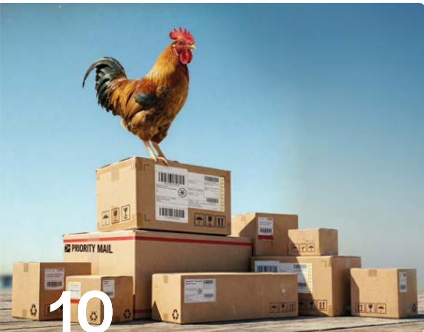
DR/Image générée par IA